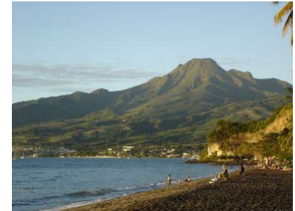
Montagne Pelée - 1902