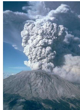
Mont Saint Helens - 1980