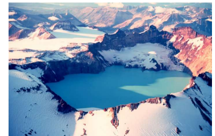
Katmai - 1912